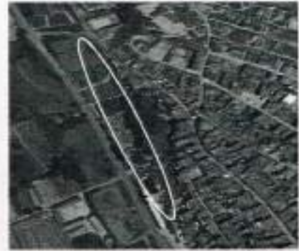
Ámbito zona de vial