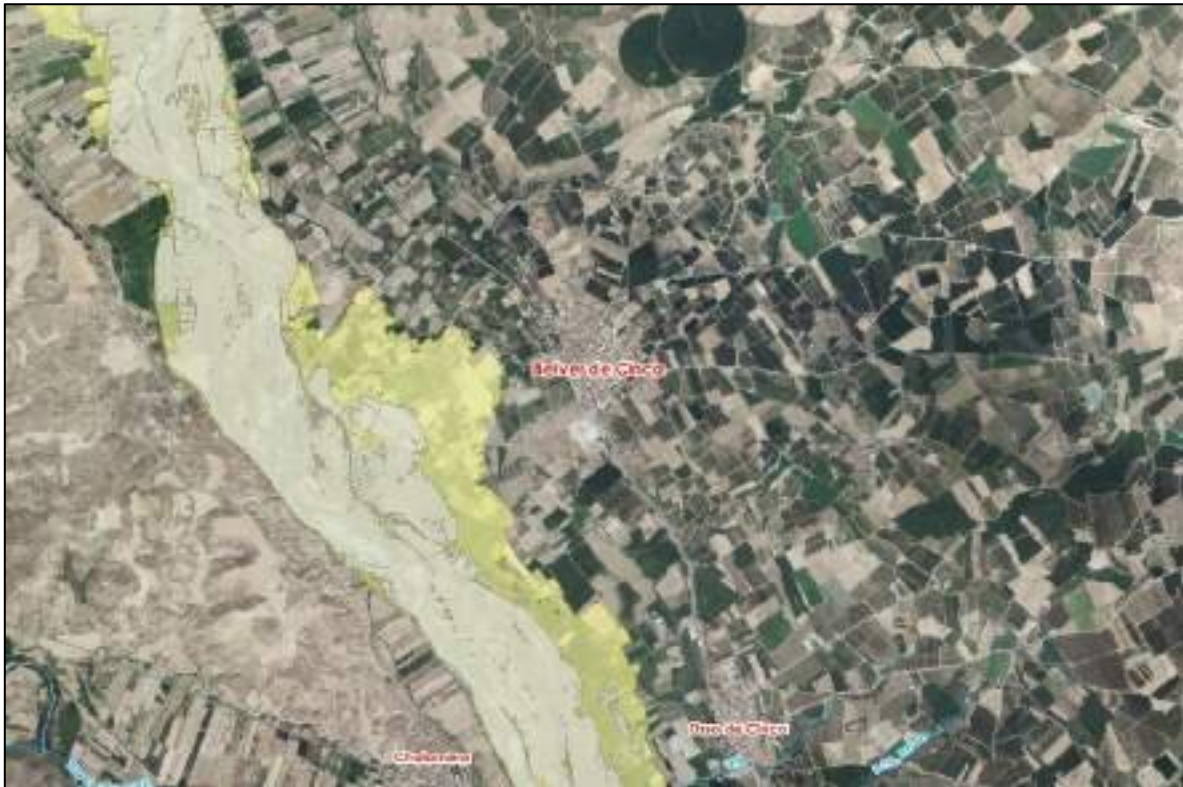
Figura 1: Zona de flujo preferente (gris) y zona inundable (amarillo) del río Cinca

V.- En primer lugar, indicar que todas las modificaciones propuestas en la documentación remitida que afectan al Suelo Urbano Consolidado (Modificaciones 5ª, 6ª, 8ª, 9ª y 11ª) se localizan fuera de la zona de afección (dominio público hidráulico y zona de policía) a cauces públicos así como de las zonas de flujo preferente y de las zonas inundables, y en consecuencia no procede la emisión de informe por parte de este Organismo de cuenca al respecto de las afecciones al dominio público hidráulico y al régimen de las corrientes.