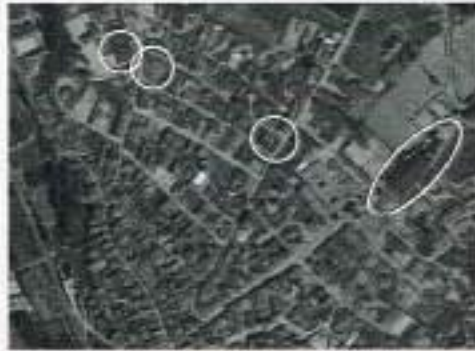
Ámbito reclasificación suelo

urbano". Por tanto, no queda claro que se pretende hacer con los terrenos adyacentes al nuevo vial.